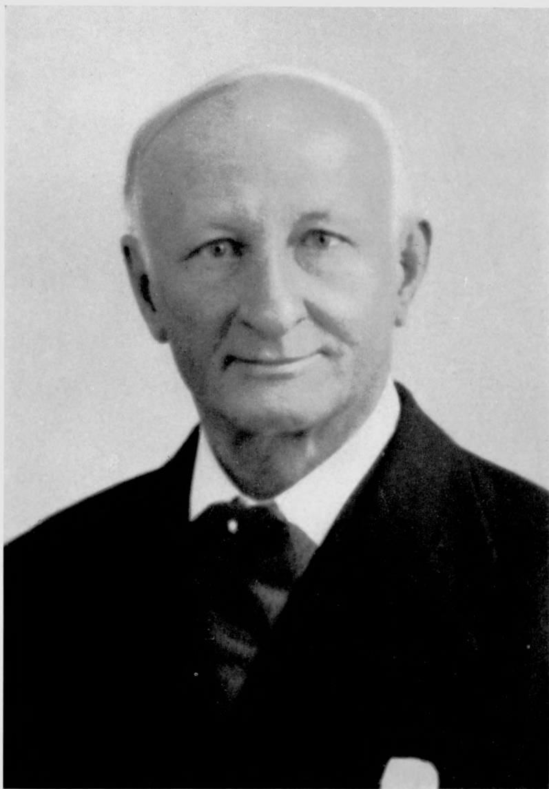
Lord William Malcolm HAILEY (15 février 1872 - 1 er juin 1969)