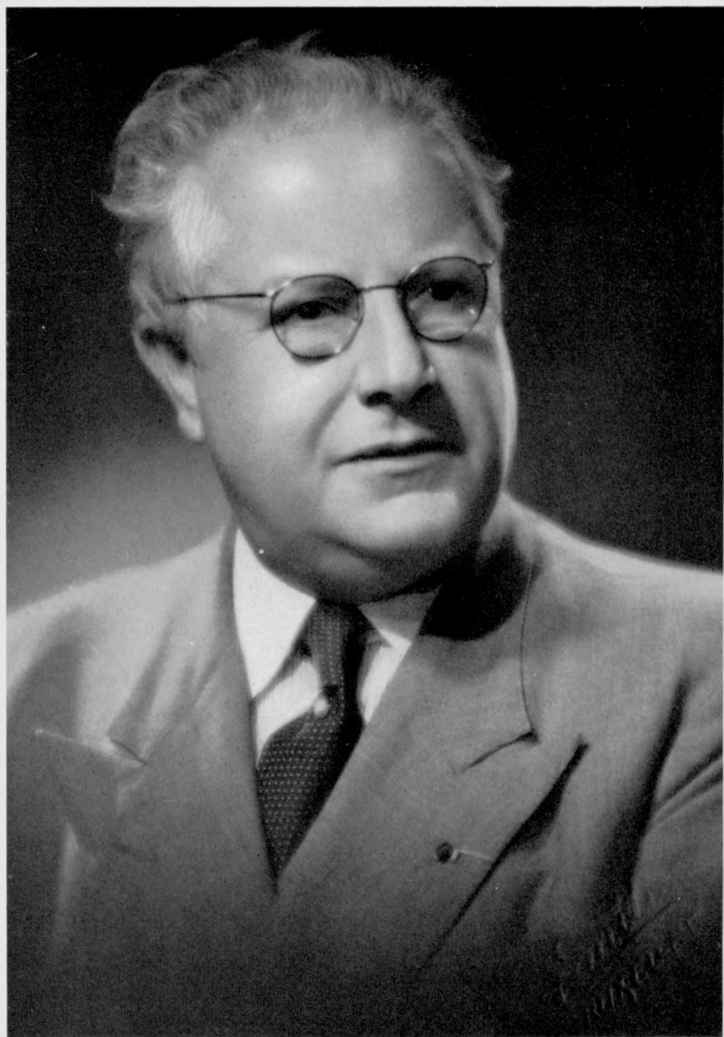
Fred VAN DER LINDEN (Mons, 18 janvier 1883 - Bruxelles, 8 juillet 1969)