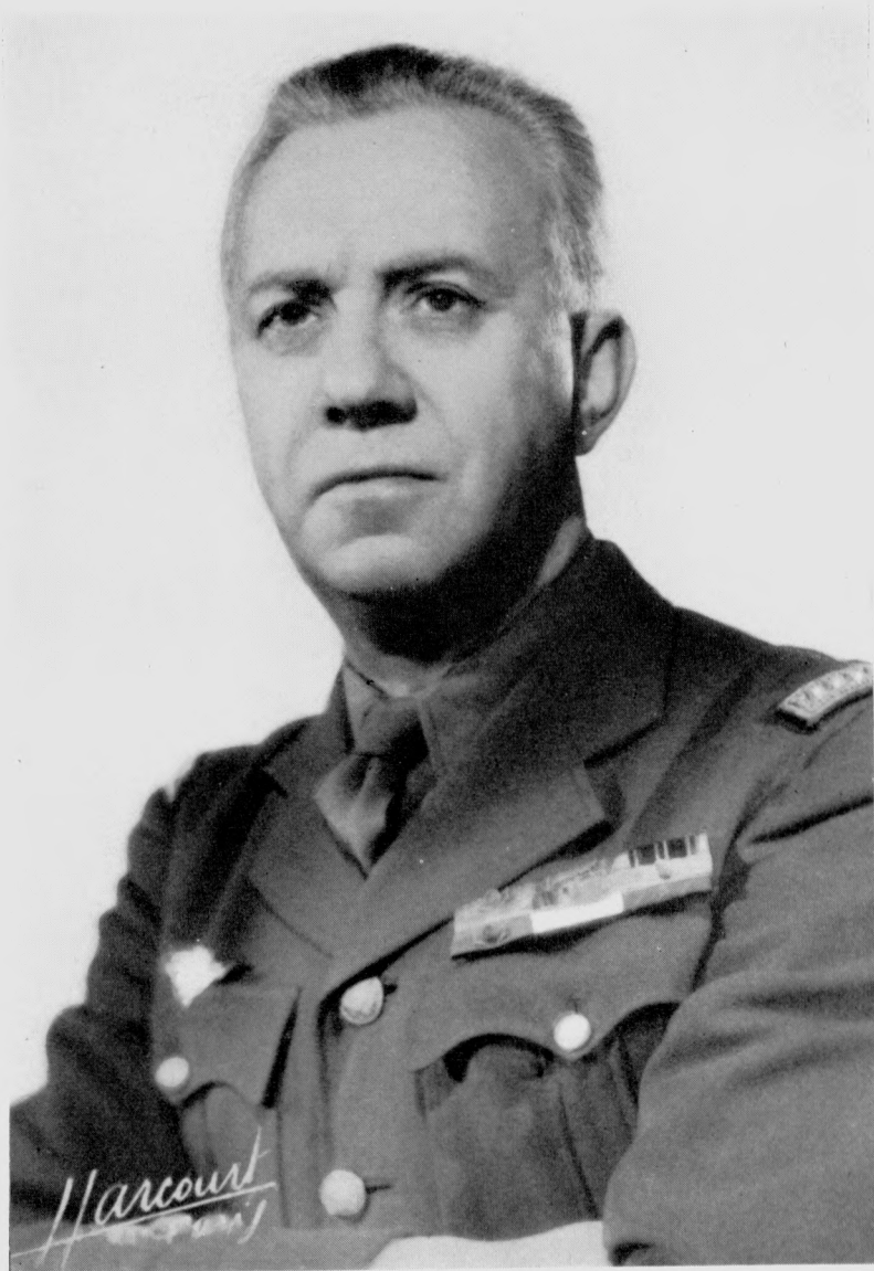
Marcel VAUCEL (Brest, 16 janvier 1894 - Paris, 15 septembre 1969)