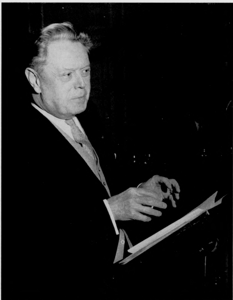
Baron Joseph Albert DE VLEESCHAUWER (1 januari 1897 — 24 februari 1971)