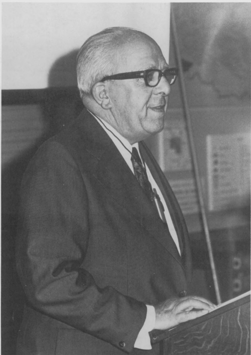
Ivan DE MAGNÉE (Hasselt, 23 mai 1905 – Ixelles, 5 février 1993)